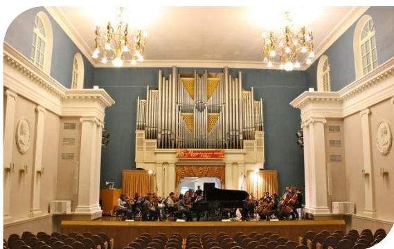
Тверская академическая областная филармония