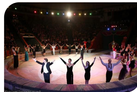
Тверской государственный цирк