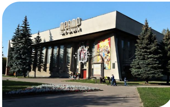
Тверской театр кукол