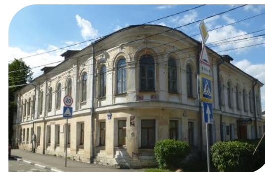
Музей М. Е. Салтыкова-Щедрина