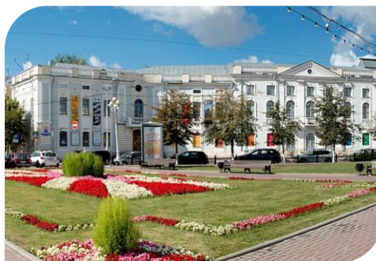
Тверской театр юного зрителя