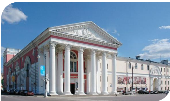
Тверской академический театр драмы